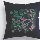
インテリアグッズ